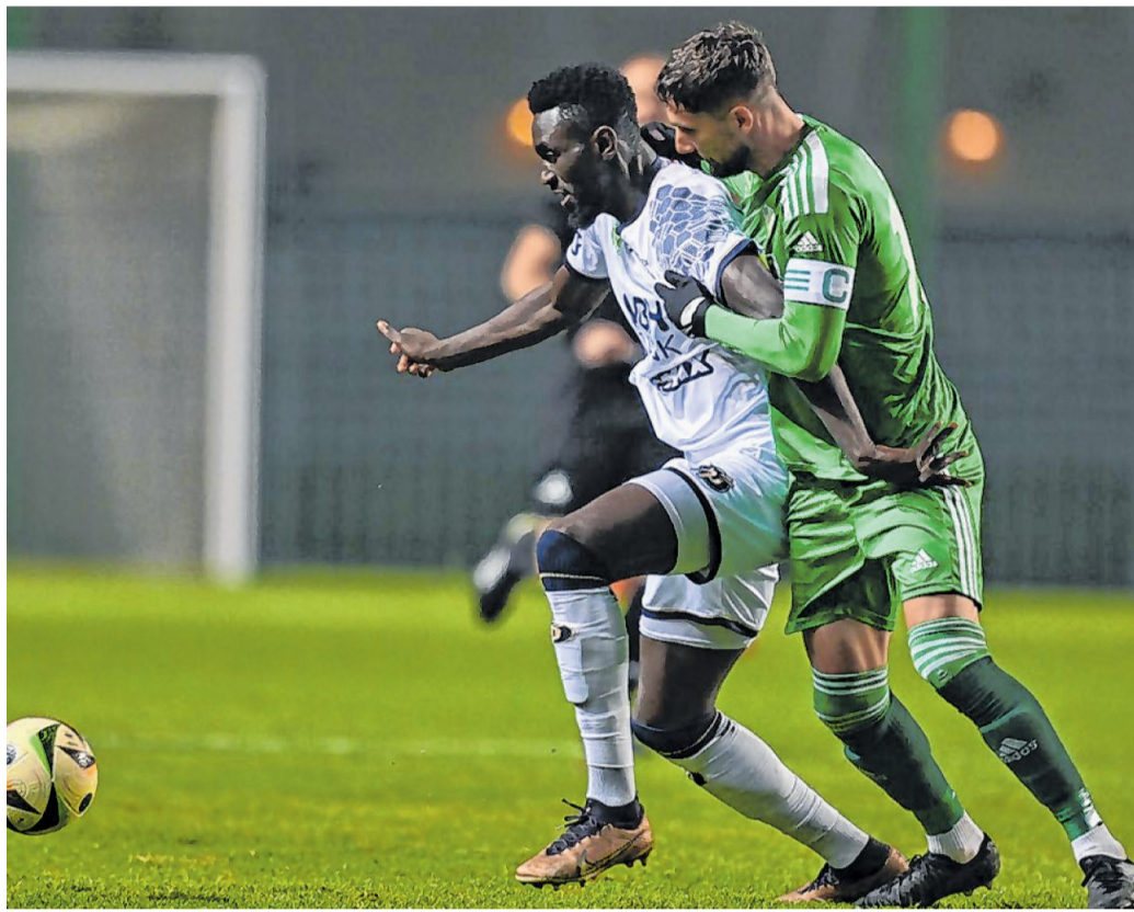
Az ETO-nak minden csapatrészen javulnia kellene a győri meccshez képest.

KAJAK-KENU. Két új név került fel a Magyar Kajak-Kenu Szövetség (MKKSZ) dicsőséghalálára: Kóhalmi Emese az örökös bajnokok, Oláh Tamás pedig a mesteredzők márványtáblájára iratkozott fel.